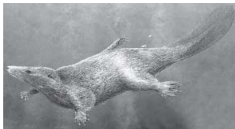
► El ‘Castorcauda lutrasmilis’ se llamó así por ser similar al castor y vivir en un río.

“Después de idas y venidas, de revisiones con el cliente, hacía que las cosas regresaran a ese croquis inicial. Recogimos esos trazos espontáneos y los publicamos a página entera”.